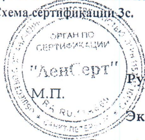
Схема сертификации Зс.